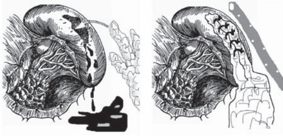
Рис. 2. Оптимизированная авторами статьи методика ушивания раны селезёнки с использованием трёх прядей большого сальника (средняя прядь – для тампонады полости раны, наружные пряди – для использования их в качестве прокладок под лигатуры)

органа и, как следствие, угроза абсцедирования, вторичного кровотечения и желчеистечения. Частота осложнений после ушивания печёночных ран, связанных с желчеистечением и желчными затёками, по данным разных авторов, колеблется в пределах 1,6–7,9% [6, 8, 9, 10]. Например, в травматологическом центре Флориды в 1986–1992 гг. ушивание печени по поводу травмы было выполнено у 175 пациентов, у 11 из них (6%) возникли желчные осложнения (биломы, желчные затёки и свищи) [10]. Это потребовало дополнительных дорогостоящих обследований, консервативного и хирургического лечения. Авторами подчёркивается, что наибольший риск возникновения таких осложнений имеется у пациентов, которым производилось ушивание глубоких разрывов печени (3–4 степень по шкале AIS) [10].