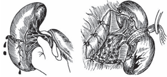
Рис. 3. Приёмы, позволяющие повысить эффективность фотокоагуляции ран селезёнки с использованием лазерного излучения или плазменного потока

Одним из перспективных способов физического гемостаза при травмах паренхиматозных органов является применение импульсной плазменной струи. Ионизированный газ (плазма) образуется при пропускании инертного газа (аргона или гелия) через электрический заряд между двумя электродами. Видимая часть плазменной струи обладает высокой температурой и за счёт этого вызывает пиролиз и коагуляционное сморщивание биологических тканей. При этом имеется возможность коагулировать сосуды печени диаметром до 7,5 мм. Несомненными достоинствами плазменного потока являются хороший гемостаз и холестаз, сравнительно небольшое дымообразование, возможность работать на «влажном» операционном поле, бактерицидность, а также простота эксплуатации оборудования и отсутствие необходимости в защите персонала [5, 33, 34]. Недостатком способа является повышенная травматизация биоткани при её нагреве плазменной струей [20, 35]. Для устранения этого недостатка предложено использовать плазменный скальпель в импульсном режиме [34]. Помимо этого, для уменьшения времени остановки кровотечения ряд авторов предлагает предварительно орошать обрабатываемую поверхность органа растворами человеческого альбумина [35, 36]. Так, в эксперименте на свиньях было показано, что предварительное орошение поверхности печени 38% раствором альбумина с последующей обработкой лучом аргонового скальпеля позволяет снизить время полного гемостаза с 154 до