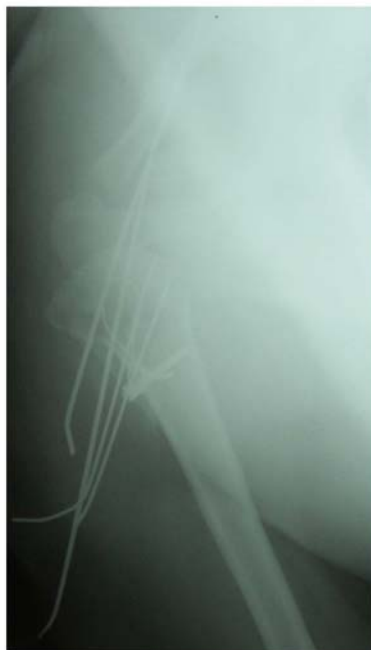
Рис.1. Рентгенограмма правого плеча и ключично-акромиального сочленения после металлоостеосинтеза перелома-вывиха плеча.

Диагностирован оскольчатый перелома-вывих хирургической шейки правого плеча с наличием смещения головки кпереди, кнутри и книзу от суставной поверхности лопатки. После соответствующей предоперационной подготовки под проводниковой анестезией произведена открытая репозиция отломков хирургической шейки и вправление вывихнутой головки правого плеча. Фрагменты и головка плечевой кости фиксированы трансартикулярно четырьмя спицами Киршнера и проволоочной петлей по Веберу. На интраоперационной рентгенограмме - репозиция достигнута (рис. 1).