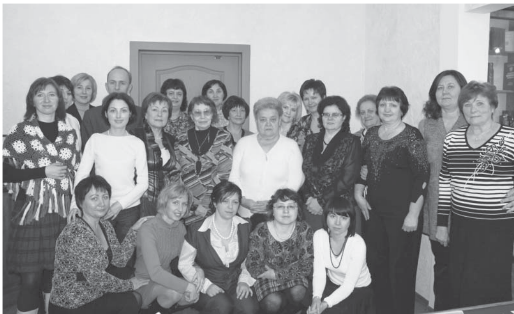
Фото 1 – Ветераны и специалисты справочного бюро г. Минска (11.12.2010 г.)

Участники встречи ознакомились с фармацевтической коллекцией кабинета истории фармации предприятия, расположенного в аптеке № 88 (ул. Сторожевская,3), передали в фонд кабинета красочно оформленный фотоальбом «История справочной аптечной службы г. Минска» и сфотографировались на память (фото 1).