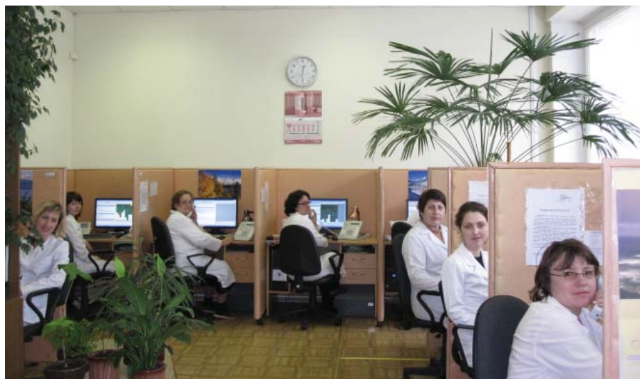
Фото 5 – Справочное бюро г. Минска в наши дни (2010 г.)

В начале 2010 г. проведено техническое переоснащение всех рабочих мест в соответствии с современными технологиями (фото 5).