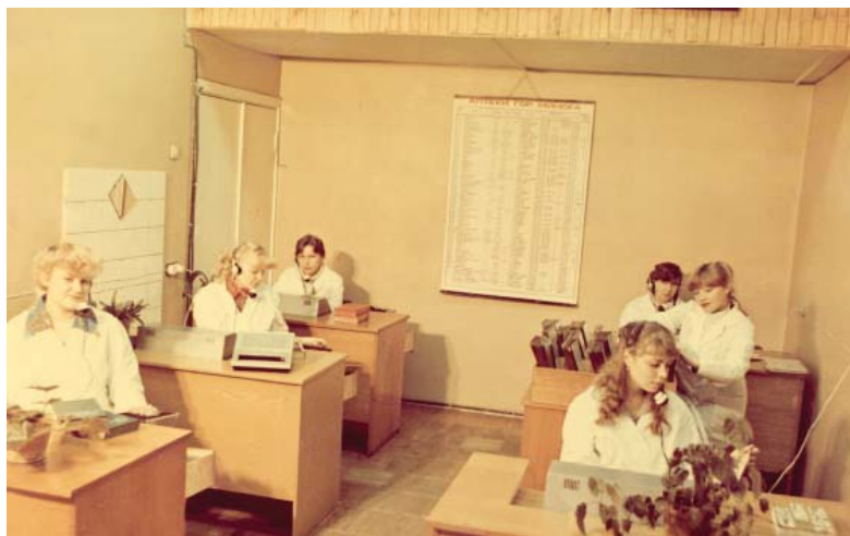
Фото 2 – Специалисты автоматизированного справочного бюро справки 0-69 за работой (г. Минск, 1982 г.)