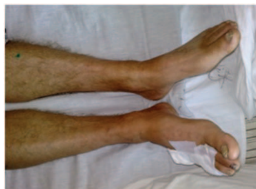
Рис. 2. Внешний вид голени на 3-и сутки после забора вены, отек отсутствует

Во всех случаях ко вторым суткам развивался стойкий выраженный лимфо-венозный отек бедра и голени (до +8 см в окружности) на стороне, где забирали бедренную вену. К 4-5 суткам во всех случаях появилась упорная лимфорея. У всех пациентов участок разреза на уровне паха на этой ноге заживал вторичным натяжением. Все остальные операционные раны зажили первично. Во всех случаях для реабилитации потребовалось значительное время (около 30 суток) с лечением в отделении хирургии сосудов и с последующим переводом в отделение гнойной хирургии. Внимания гнойных хирургов преимущественно требовали трофические язвы и лимфорея из разреза на ноге со стороны забора вены.