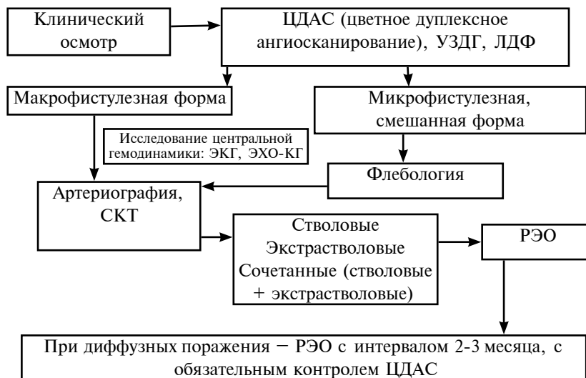
Рис. 1. Алгоритм лечебно-диагностических мероприятий при наличии АВ фистул

Выбор оптимальной комбинации способа диагностики определяется клиническими данными.