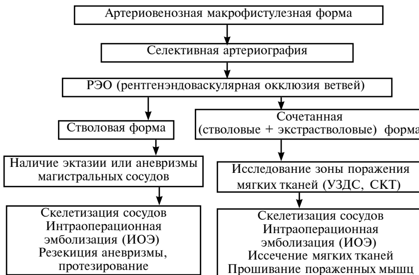
Рис. 2. Алгоритм диагностики и лечения артериовенозных макрофистулезных форм

ской точки зрения, ведь еще до оперативного вмешательства появляется возможность оценить функциональную пригодность пораженных мышц, целесообразность частичного или полного их удаления. СКТ с контрастным усилением (СКТ-ангиография) также показана для выявления локализации аномалии, оценки строения АВ аневризмы и определения вовлечения костей. Особенно важна информация о состоянии окружающих тканей для диагностики и лечения экстрастволовых и сочетанных форм ВСМ (рис. 2).