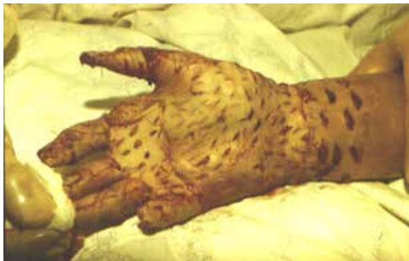
Рис 1. Свободная кожная пластика полнослойными перфорированными утильными кожными лоскутами

пальцев. Пациент 28 лет, доставлен в клинику травматологии, ортопедии и ВПХ через 3 часа после получения производственной травмы. Ногтевые фаланги пальцев левой кисти попали между валами прессующей полиэтиленовую пленку машины. В момент травмы пострадавший резко дернул руку. В результате произошло полное скальпирование кожных покровов пальцев и кисти до нижней трети предплечья по типу «перчатки». Вместе с пострадавшим в стационар доставили утильный скальпированный кожный покров.