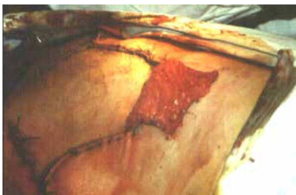
Рис. 3 В. Несвободный кожно-жировой лоскут