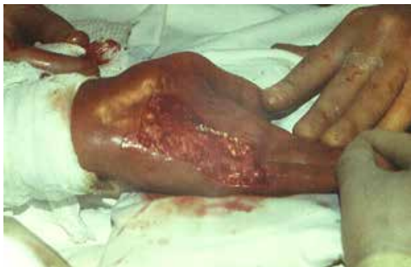
Рис. 3 А. Глубокий дефект мягких тканей ладонной поверхности правой кисти, после иссечения грубых посттравматических рубцов и устранения сгибательных дерматогенных контрактур IV-V пальцев