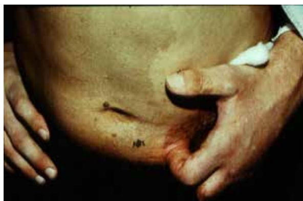
Рис. 4. Несвободная кожная пластика стеблем Филатова циркулярной скальпированной раны средней и ногтевой фаланг II пальца левой кисти

Местную кожную пластику (у 78 пациентов) в основном применяли для закрытия культей пальцев при травматических отчленениях и ранах с небольшим (до 3 см.) дефектом кожного покрова. Использовали различные варианты местной пластики: мобилизация краев кожи вокруг раны с помощью дополнительных разрезов, пластика встречными треугольниками, различные способы торцевой пластики. Имевшие место неудачные исходы (в 15,2% случаев) связаны в основном с недооценкой жизнеспособности используемых лоскутов, а также с применением нерациональных разрезов.