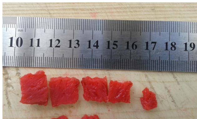
Рисунок 2. Полное окрашивание образцов через 48 ч.

Через 48 ч фиксации образцы были окрашены полностью (рисунок 2).