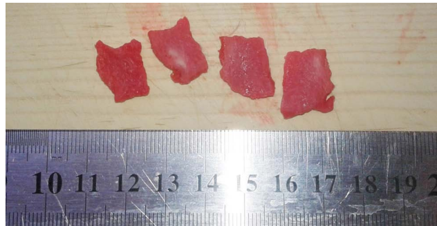
Рисунок 1. Белесоватые непрокрашенные участки в центре образцов, время фиксации 24 ч.

Оценка скорости и полноты фиксации путем добавления пищевого красителя E124-понсон 4R в забуференный формалин 0,1 мг/мл апробирована нами на 57 образцах срочного биопсийного исследования лейомиом (заявка на патент № а20160264 от 07.07. 2016 г.). В операционном блоке Витебского областного клинического онкологического диспансера в двух случаях РМЖ, удаленных в ходе операции при размерах опухоли более 2 см через 10 мин после отсечения были вырезаны кусочки размером 0,8×0,8×0,3 см и помещены в формалин с добавлением пищевого красителя. Остальной материал исследовался по стандартной методике. При этом в данных случаях был определен инфильтративный протоковый РМЖ. Кусочки с добавлением в формалин красителя хранились при комнатной температуре 24-48 ч. При времени фиксации 24 ч на фоне красного окрашивания наблюдались не прокрашенные белесоватые участки в центре образца (рисунок 1).